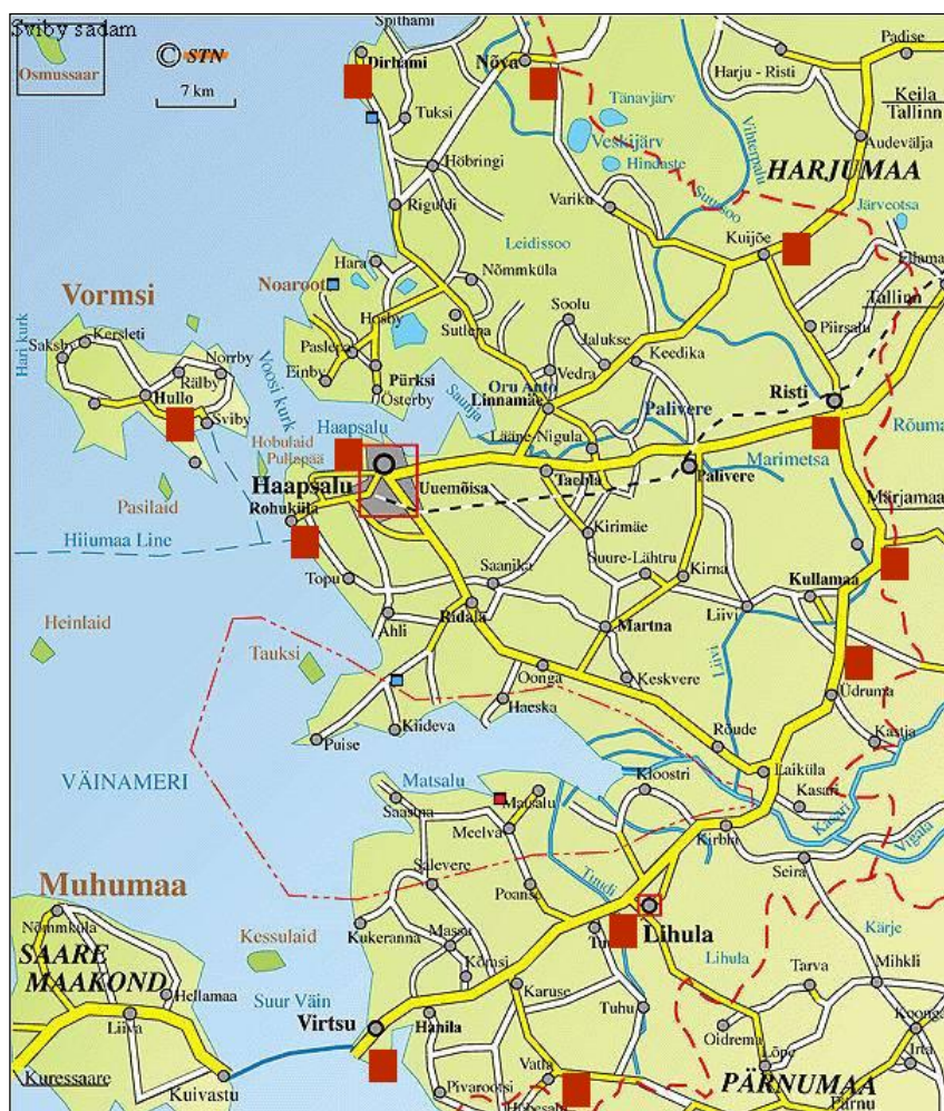
Joonis 1. Väravad Läänemaal (märgitud punasega)