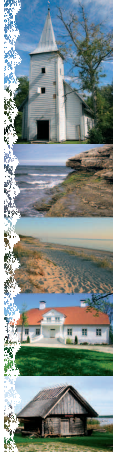
▲ Kirche Nõva Kalksteinküste auf Osmussaare Strand Elbu Gutshof Saare Das Museum der Küstenschweden in Haapsalu

Bitte bemerken: Vor der Reise das Touristeninformationszentrum Haapsalu in Karja str.15 besuchen. Die Marschroute nimmt etwa 4-5 Stunden Zeit, mit Museumsbesuchen und Wanderwegen den ganzen Tag. In Nõva gibt es keine Tankstellen, sondern in Padise und Linnamäe.