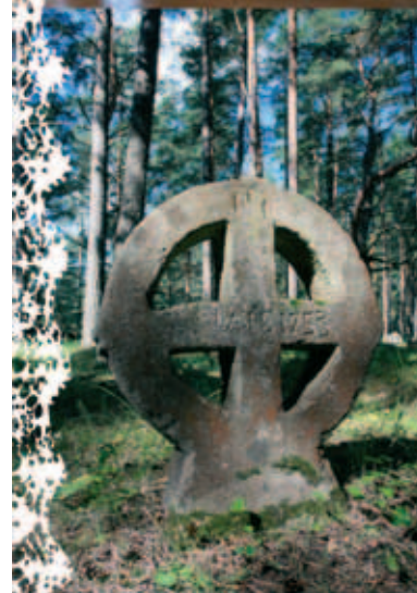
Bauernhof in Rumpo Holzskulptur in der Kirche Vormsi Keltenkreuz auf dem Friedhof

Kontakte: Touristeninformation Haapsalu Karja 15, Haapsalu, Estland Tel +372 473 3248 haapsalu@visitestonia.com www.westest.ee www.visitestonia.com http://avasta.laanemaa.ee